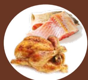
Plats cuisinés, viande et poisson crus