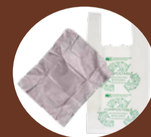
Emballages, sacs en plastique