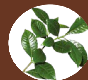
Tontes, petits branchages, tailles de haie, branches