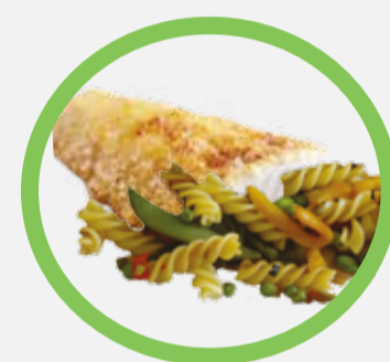
Petits restes : pain, pâtes, croûtes de fromage...