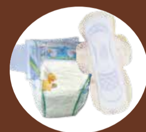
Couches, serviettes hygiéniques