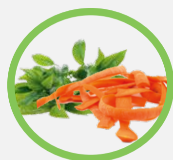
Épluchures de fruits et légumes