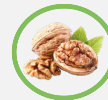
Coquilles de noix et noisettes broyées