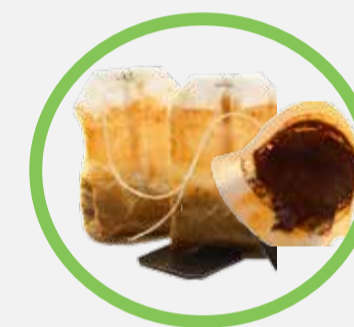
Marc de café + filtre, sachets de thé